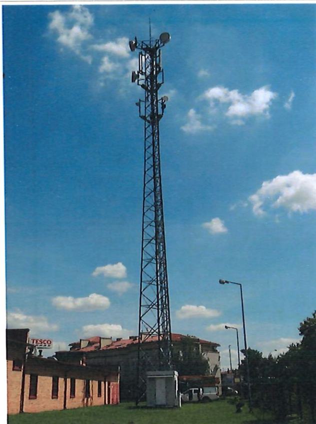
Fot. 1. BS Stalowa Wola – widok obiektu