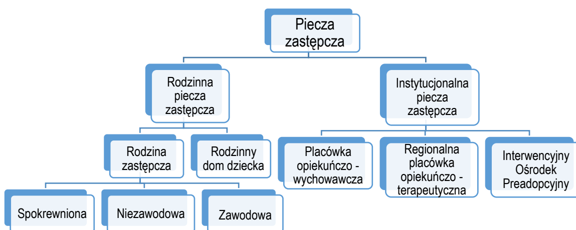
Diagram 1. Formy pieczy zastępczej w Polsce.